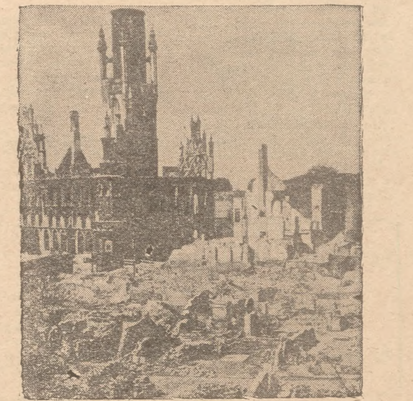
DE VERWOESTE ABDIJ VAN MIDDELBURG.